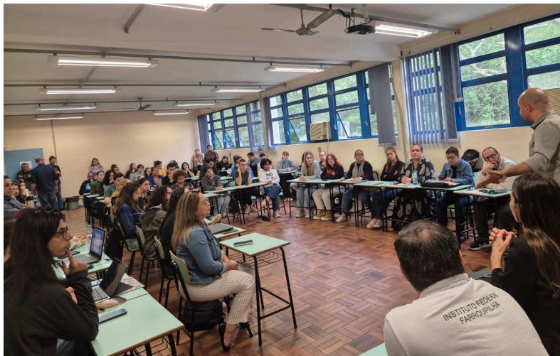
Eixos Temáticos - Polo Santa Maria, 08 de abril de 2026.