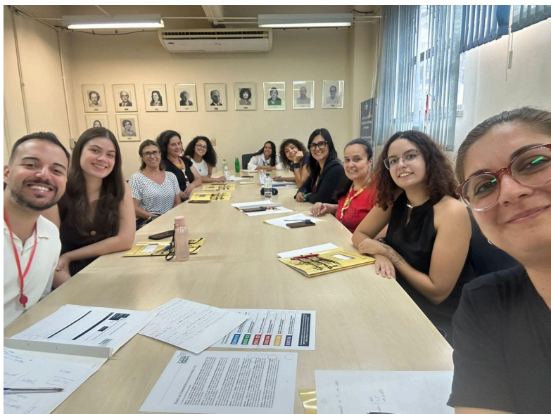
Eixos Temáticos - Polo Porto Alegre, 07 de abril de 2026.