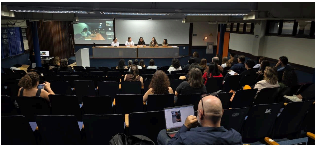
Plenária de Abertura - Auditório 01 da FABICO, Porto Alegre, 07 de abril de 2026.