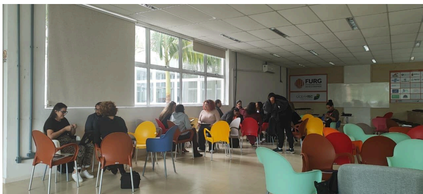
Eixos Temáticos - Polo Rio Grande, 07 de abril de 2026.