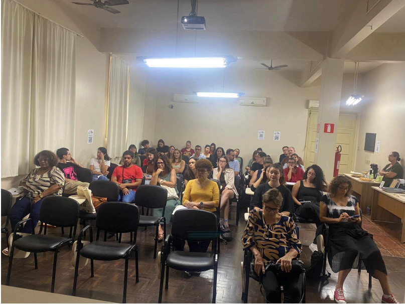
Plenária final - Porto Alegre, 15 de abril de 2026.