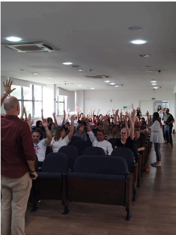
Plenária final - Santa Maria, 15 de abril de 2026.