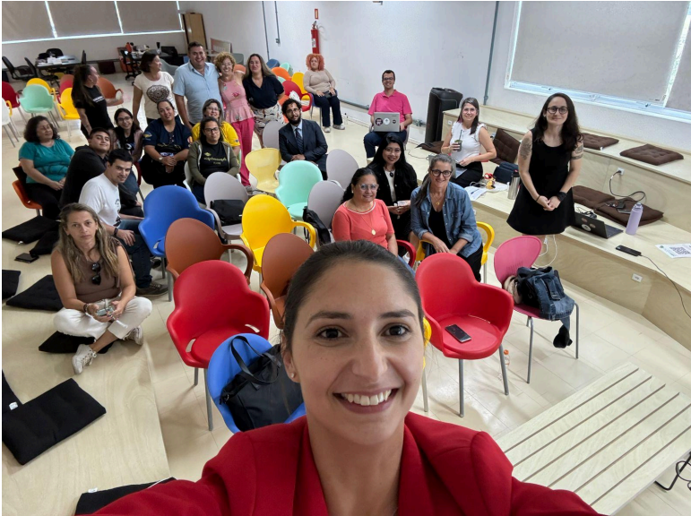
Plenária final - Rio Grande, 15 de abril de 2026.